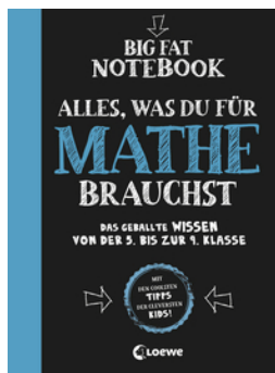
Big Fat Notebook - Alles, was du für Mathe brauchst - Das geballte Wissen von der 5. bis zur 9. Klasse