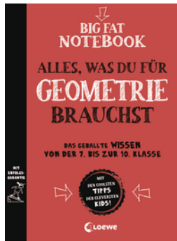
Big Fat Notebook - Alles, was du für Geometrie brauchst