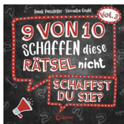
9 von 10 schaffen diese Rätsel nicht - schaffst du sie? - Vol. 3