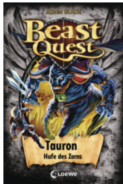
Beast Quest (Band 66) - Tauron, Hufe des Zorns