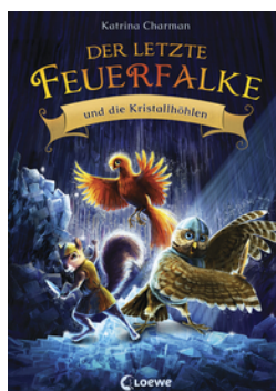
Der letzte Feuerfalke und die Kristalhöhlen (Band 2)