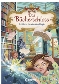
Das Bücherschloss (Band 6) - Schülerin der dunklen Magie