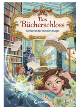
Das Bücherschloss (Band 6) - Schülerin der dunklen Magie