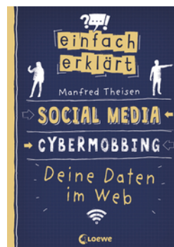
Einfach erklärt - Social Media - Cybermobbing - Deine Daten im Web