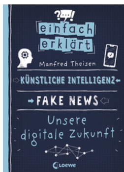
Einfach erklärt - Künstliche Intelligenz - Fake News - Unsere digitale Zukunft