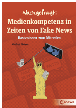
Nachgefragt: Medienkompetenz in Zeiten von Fake News