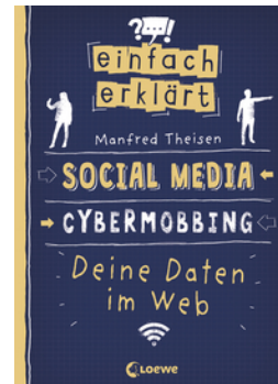
Einfach erklärt - Social Media - Cybermobbing - Deine Daten im Web