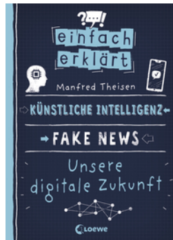
Einfach erklärt - Künstliche Intelligenz - Fake News - Unsere digitale Zukunft