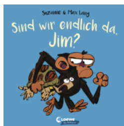
Sind wir endlich da, Jim?