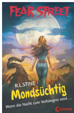
Fear Street 57 - Mondsüchtig