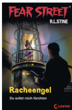
Fear Street 60 - Racheengel