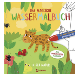
Das magische Wassermalbuch - In der Natur