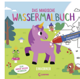
Das magische Wassermalbuch - Einhörner