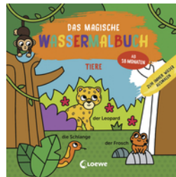
Das magische Wassermalbuch - Tiere