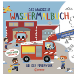
Das magische Wassermalbuch - Bei der Feuerwehr