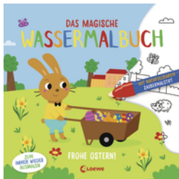
Das magische Wassermalbuch - Frohe Ostern!