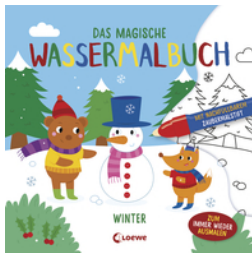
Das magische Wassermalbuch - Winter