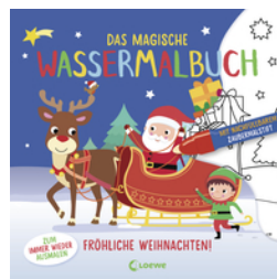
Das magische Wassermalbuch - Fröhliche Weihnachten!