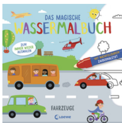
Das magische Wassermalbuch - Fahrzeuge