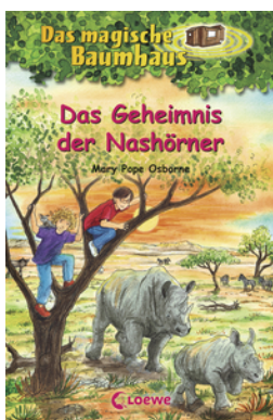
Das magische Baumhaus (Band 61) - Das Geheimnis der Nashörner