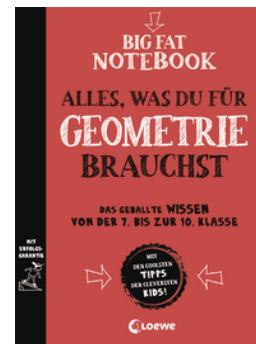
Big Fat Notebook - Alles, was du für Geometrie brauchst