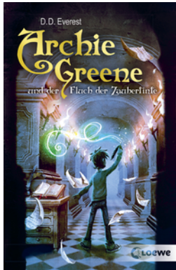
Archie Greene und der Fluch der Zaubertinte (Band 2)