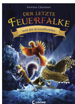
Der letzte Feuerfalk und die Kristallhöhlen (Band 2)