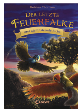
Der letzte Feuerfalk und die flüsternde Eiche (Band 3)