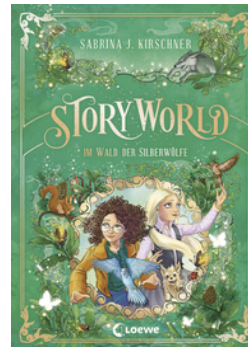
StoryWorld (Band 2) - Im Wald der Silberwölfe