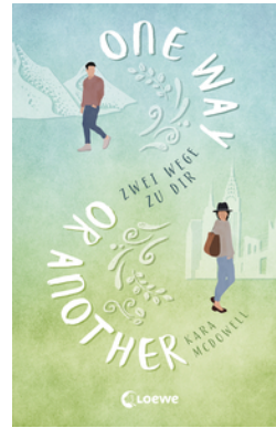
One Way Or Another