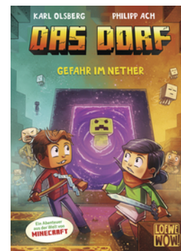
Das Dorf (Band 2) - Gefahr im Nether