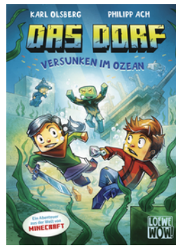
Das Dorf (Band 5) - Versunken im Ozean