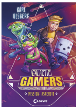
Galactic Gamers (Band 2) - Mission: Asteroid