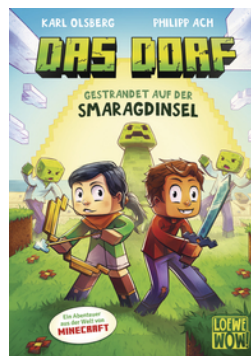
Das Dorf (Band 1) - Gestrandet auf der Smaragdinsel