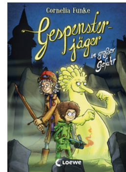
Gespensterjäger in großer Gefahr