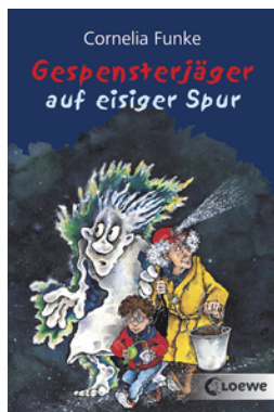
Gespensterjäger auf eisiger Spur