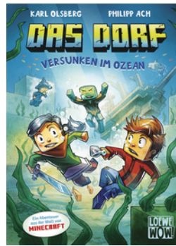
Das Dorf (Band 5) - Versunken im Ozean