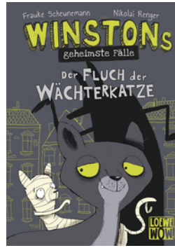
Winstons geheimste Fälle (Band 1) - Der Fluch der Wächterkatze