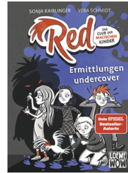
Red - Der Club der magischen Kinder (Band 2) - Ermittlungen undercover