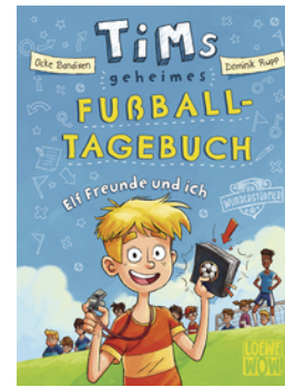
Tims geheimes Fußball-Tagebuch (Band 1) - Elf Freunde und ich!