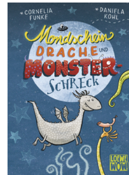
Mondscheindrache und Monsterschreck