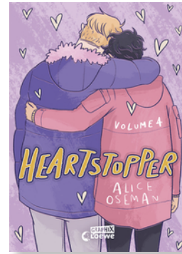
Heartstopper Volume 4 (deutsche Hardcover- Ausgabe)