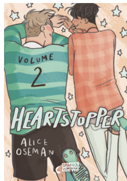
Heartstopper Volume 2 (deutsche Ausgabe)