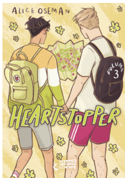
Heartstopper Volume 3 (deutsche Ausgabe)