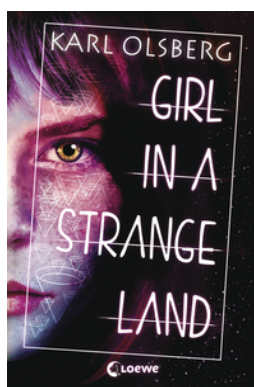
Girl in a Strange Land