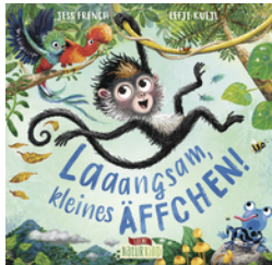
Laaangsam, kleines Äffchen!