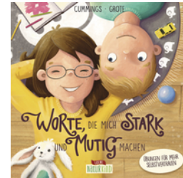
Worte, die mich stark und mutig machen