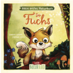
Mein erstes Naturbuch - Der Fuchs