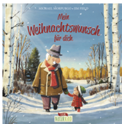
Mein Weihnachtswunsch für dich