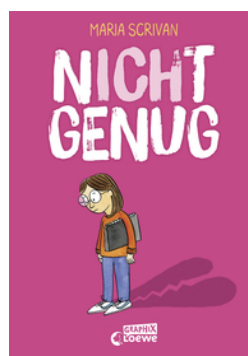
nIcHt genug (nIcHt genug-Reihe - Band 1)