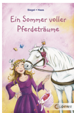
Ein Sommer voller Pferdeträume