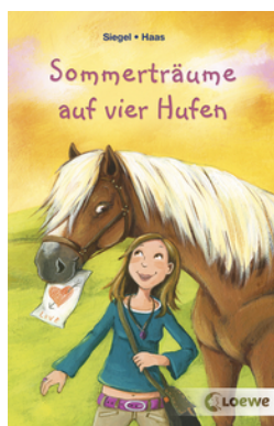
Sommerträume auf vier Hufen