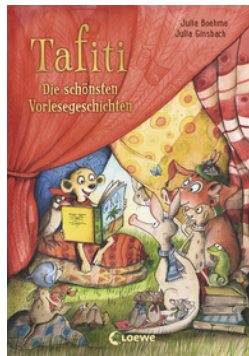
Tafiti - Die schönsten Vorlesegeschichten