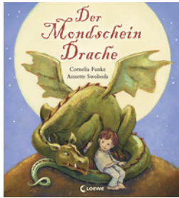
Der Mondschein- Drache