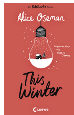
This Winter (deutsche Ausgabe)