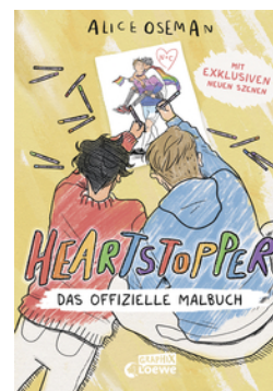
Heartstopper - Das offizielle Malbuch