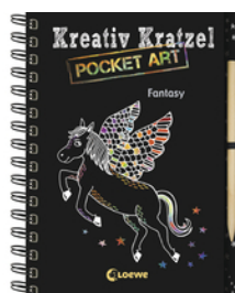
Kreativ-Kratzel Pocket Art: Fantasy