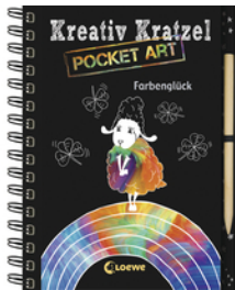
Kreativ-Kratzel Pocket Art: Farbenglück