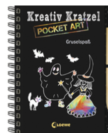
Kreativ-Kratzel Pocket Art: Gruselspaß