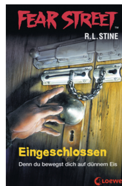
Fear Street 53 - Eingeschlossen