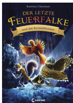
Der letzte Feuerfalk und die Kristallhöhlen (Band 2)