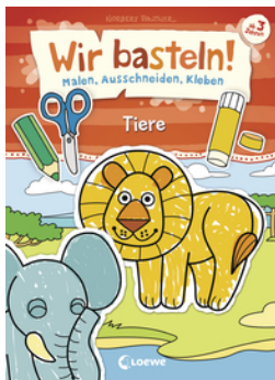
Wir basteln! - Malen, Ausschneiden, Kleben - Tiere