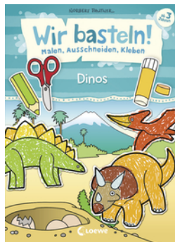
Wir basteln! - Malen, Ausschneiden, Kleben - Dinos