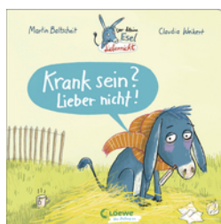
Der kleine Esel Liebernicht - Krank sein? Lieber nicht!