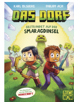
Das Dorf (Band 1) - Gestrandet auf der Smaragdinsel