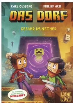
Das Dorf (Band 2) - Gefahr im Nether