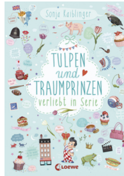
Verliebt in Serie (Band 3) - Tulpen und Traumprinzen