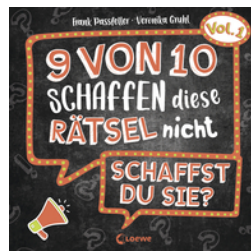
9 von 10 schaffen diese Rätsel nicht - schaffst du sie? - Vol. 1