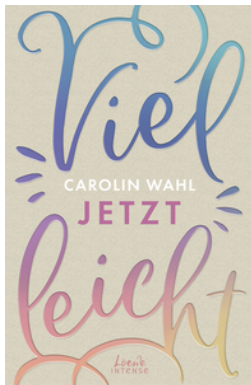
Vielleicht jetzt (Vielleicht-Trilogie, Band 1)