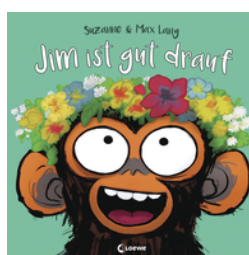
Jim ist gut drauf