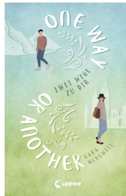
One Way Or Another