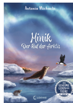
Das geheime Leben der Tiere (Ozean) - Minik - Der Ruf der Arktis