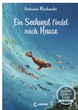
Das geheime Leben der Tiere (Ozean) - Ein Seehund findet nach Hause