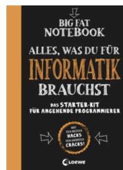
Big Fat Notebook - Alles, was du für Informatik brauchst - Das Starterkit für angehende Programmierer