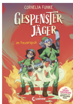
Gespensterjäger im Feuertopk (Band 2) - Mit 8 neu illustrierten Farbseiten