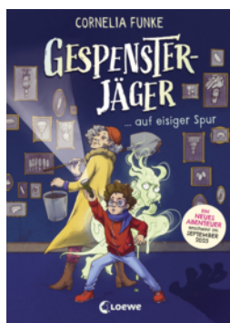
Gespensterjäger auf eisiger Spur (Band 1) - Mit 8 neu illustrierten Farbseiten