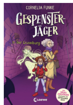
Gespensterjäger in der Gruselburg (Band 3) - Mit 8 neu illustrierten Farbseiten