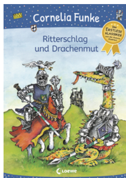
Ritterschlag und Drachenmut