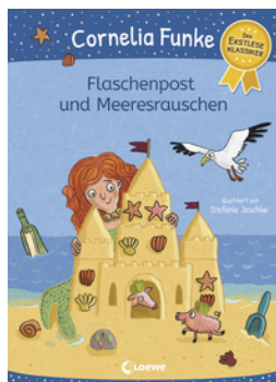
Flaschenpost und Meeresrauschen