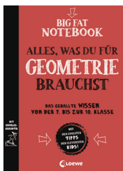
Big Fat Notebook - Alles, was du für Geometrie brauchst