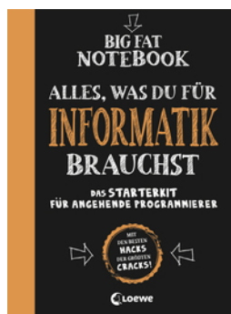
Big Fat Notebook - Alles, was du für Informatik brauchst