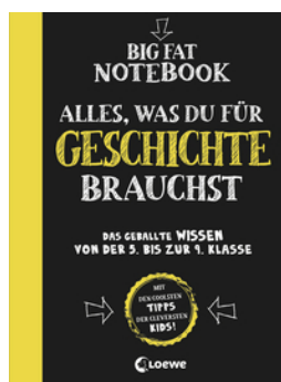
Big Fat Notebook - Alles, was du für Geschichte brauchst