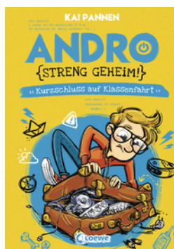
Andro, streng geheim! (Band 3) - Kurzschluss auf Klassenfahrt