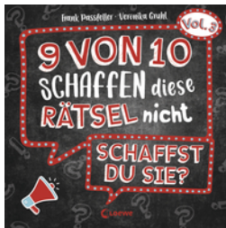
9 von 10 schaffen diese Rätsel nicht - schaffst du sie? - Vol. 3