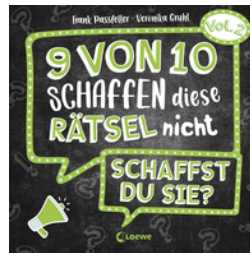
9 von 10 schaffen diese Rätsel nicht - schaffst du sie? - Vol. 2