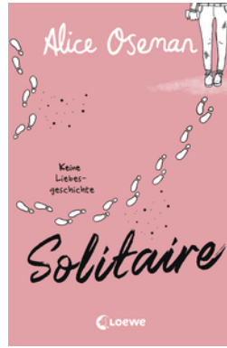
Solitaire (deutsche Ausgabe)