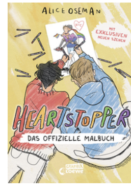
Heartstopper - Das offizielle Malbuch