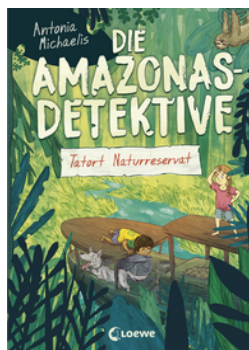
Die Amazonas-Detektive (Band 2) - Tatort Naturreservat