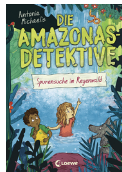
Die Amazonas-Detektive (Band 3) - Spurensuche im Regenwald