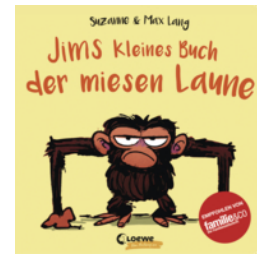
Jims kleines Buch der miesen Laune