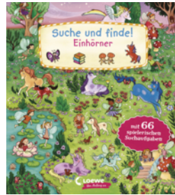
Suche und finde! Einhörner