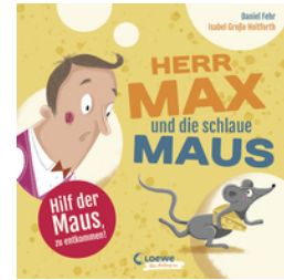
Herr Max und die schlaue Maus