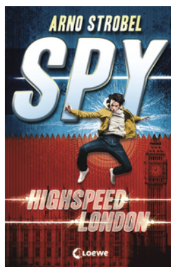
SPY (Band 1) - Highspeed London