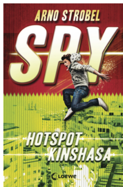
SPY (Band 2) - Hotspot Kinshasa