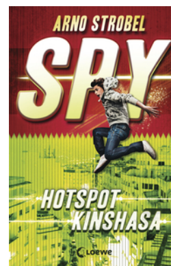
SPY (Band 2) - Hotspot Kinshasa