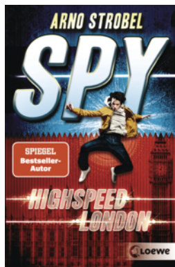
SPY (Band 1) - Highspeed London