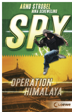
SPY (Band 3) - Operation Himalaya