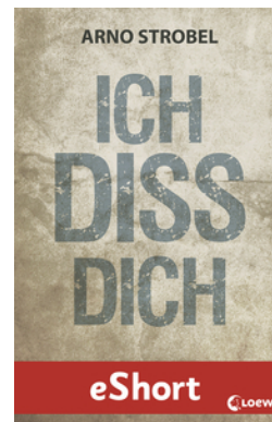
Ich diss dich