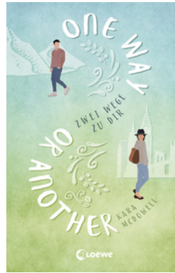
One Way Or Another