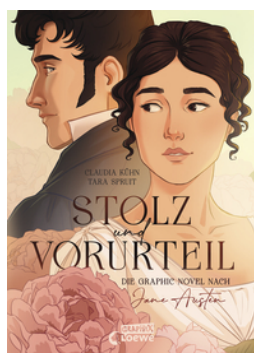
Stolz und Vorurteil - Die Graphic Novel nach Jane Austen